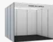
TIPO N. Espacio 9m 2 (3x3)