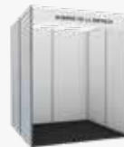
TIPO C. Espacio 4m 2 (2x2)