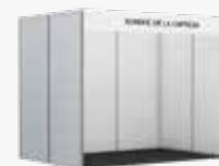
TIPO S. Espacio 6m 2 (3x2)